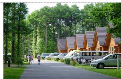
オートリゾート 苫小牧アルテン

初級者から登山愛好者まで幅広い層に人気の『樽前山』。東山登山道見晴台からの支笏湖は一見の価値あり！七合目ヒュッテまでは車が徒歩でしか行けませんのでご注意ください。