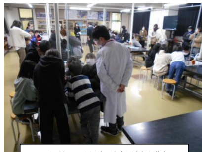
5年生 理科(専科授業)