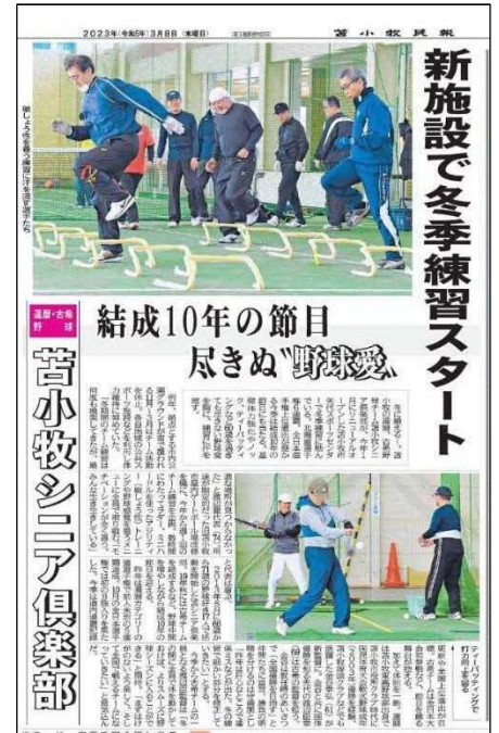
昔小牧民報 2023年3月8日掲載

多目的な施設として令和5年1月11日にオープン 野球やフットサルの利用者数が増加