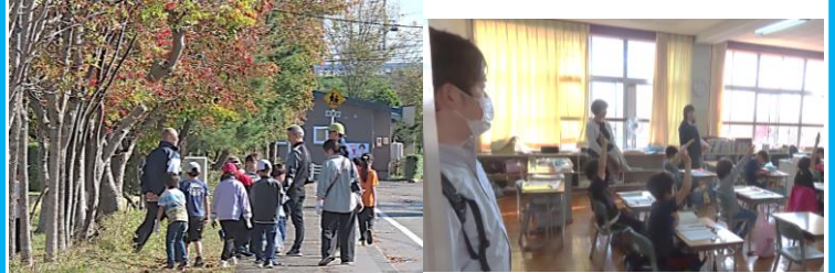
小・中合同ゴミ拾い

勇払小・中学校では、日頃から情報を交流しながら、勇払っ子9年間の成長を見据えた教育活動を行っています。 11月6日(水)には勇払中学校の教員が、小学校の授業を見学し、その後に意見交換をしました。また、10月16日(水)には、今年度2回目の合同ゴミ拾いを実施しました。