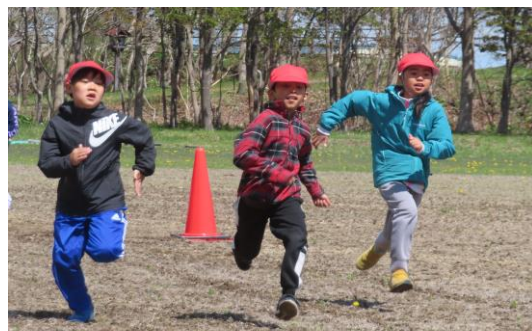
紅白リレーに向けた全児童タイムの測定