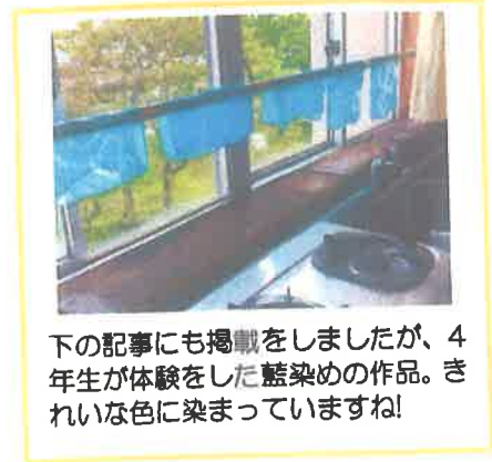
下の記事にも掲載をしましたが、4年生が体験をした藍染めの作品。きれいな色に染まっていますね!