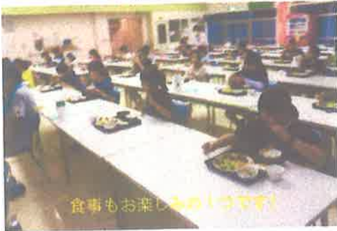
食事もお楽しみの一つです！