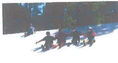
ハイウェイオアシスでは、巨大滑り台を楽しみました