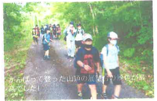
がんばって登った山頂の展望台の景色が最高でした！

昨年度から、5・6年合同により隔年での実施となった修学旅行と宿泊研修。今年度は宿泊研修で「ネイパル砂川」を訪問し、周囲の自然を利用した体験活動を行いました。山頂を目指した「石山登山」、「こどもの国」での巨大滑り台、真っ暗な森の中を歩く「ナイトハイキング」、クイズを解きながら森を歩く「ネイチャーハイク」などのほか、宿泊施設の体育館を使って友達との交流を深めました。