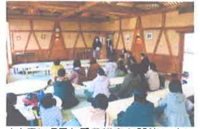
14日にPTA 委員総会を開催しました。1年間のご協力を宜しくお願い致します。