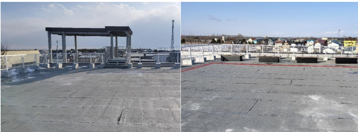
【転落防止柵 北側・南側】