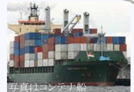
写真はコンテナ船