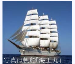
写真は帆船「海王丸」

苫小牧港は様々な種類の 船が寄港することが特徴 です。しかも大型の船が 多く、その迫力は圧倒的!