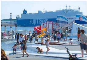
写真はキラキラ公園

キラキラ公園やふる さと海岸など、1日中 遊んでも飽きないレ ジャースポットがあ ふれています。