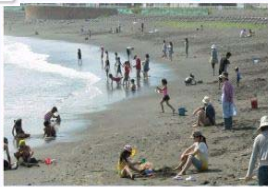
写真はふるさと海岸

キラキラ公園やふる さと海岸など、1日中 遊んでも飽きないレ ジャースポットがあ ふれています。