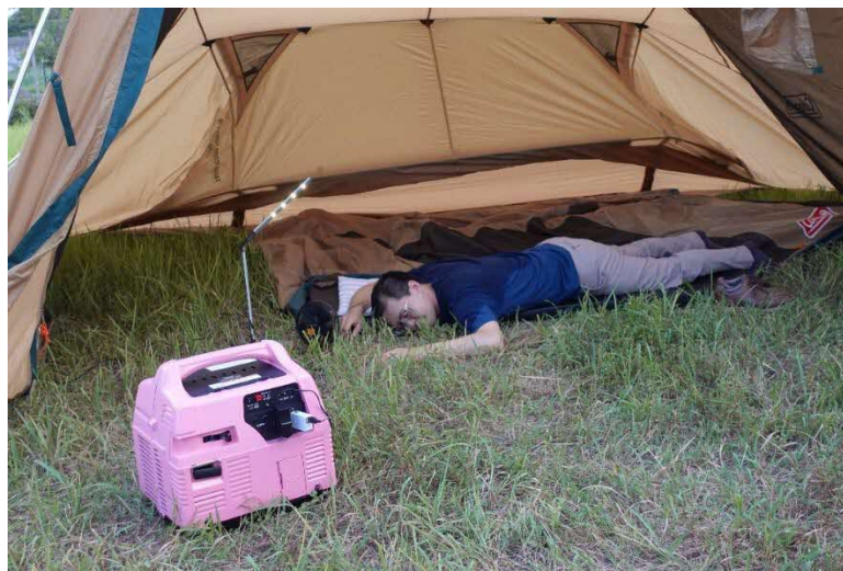
図1 一酸化炭素中毒事故のイメージ (テント入口で携帯発電機を使用)