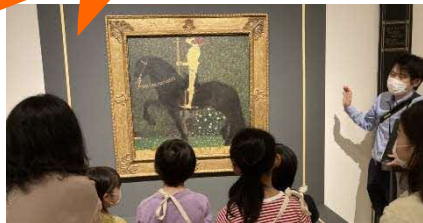
クリムト《人生は戦いなり》1903年愛知県美術館蔵

今回はトヨタ自動車北海道株式会社の創業30周年を記念して開催されている特別展。豪華な展示をなんと大人も子どもも無料で観ることが出来ます！