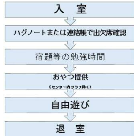
放課後児童クラブ1日の流れ（例）

次の全てに該当する児童が対象となります。ただし、 定員を超過した場合は入会待ちとなる ことがあります。