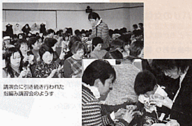
講演会に引き続き行われた指編み講習会の様子

講演会の終わりに、参加者のおひとりが、「今日は誘ってくれたとなりの方のおかげで、テレビで見ていた先生にお会いするために来ました。でも、私には孫が二人いますが、私にできることはこういう話を孫に伝えていくことだと、先生のおかげでいろんな勉強をさせていただきました。ほんとにありがとうございました。」と話されていました。