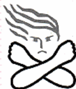
女性に対する暴力根絶のためのシンボルマーク

平日の午前 8 時 45 分から午後 5 時 15 分まで ※夜間・休日等の緊急連絡先は、市役所 (0144) 32-6111 です。