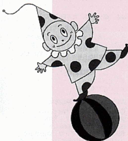
両立支援キャラクター 両立するべえ

A 休業を妻と交代するなど短期間であっても積極的に男性も育児等に参加しましょう。妻が専業主婦でも育児が困難な状況なら(産後8週間以内など)休業できます。