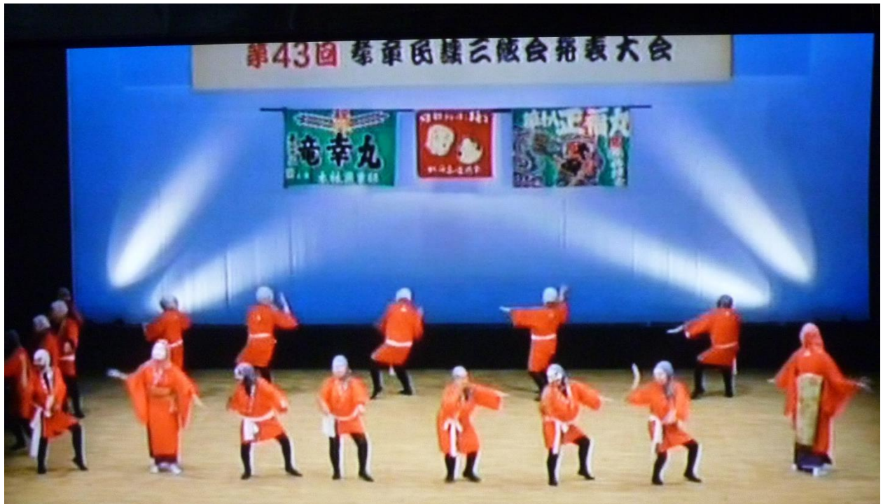
民謡団体発表会での特別出演のようす（H30年3月：苫小牧市）