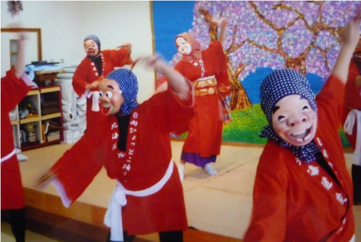
老人福祉施設での公演のようす（H30年3月：苫小牧市）