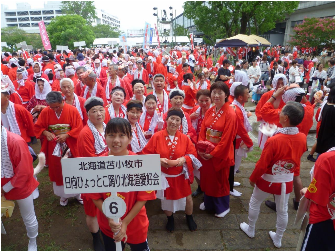
日向ひよっこ夏まつり参加のようす（H29年8月：宮崎県日向市）