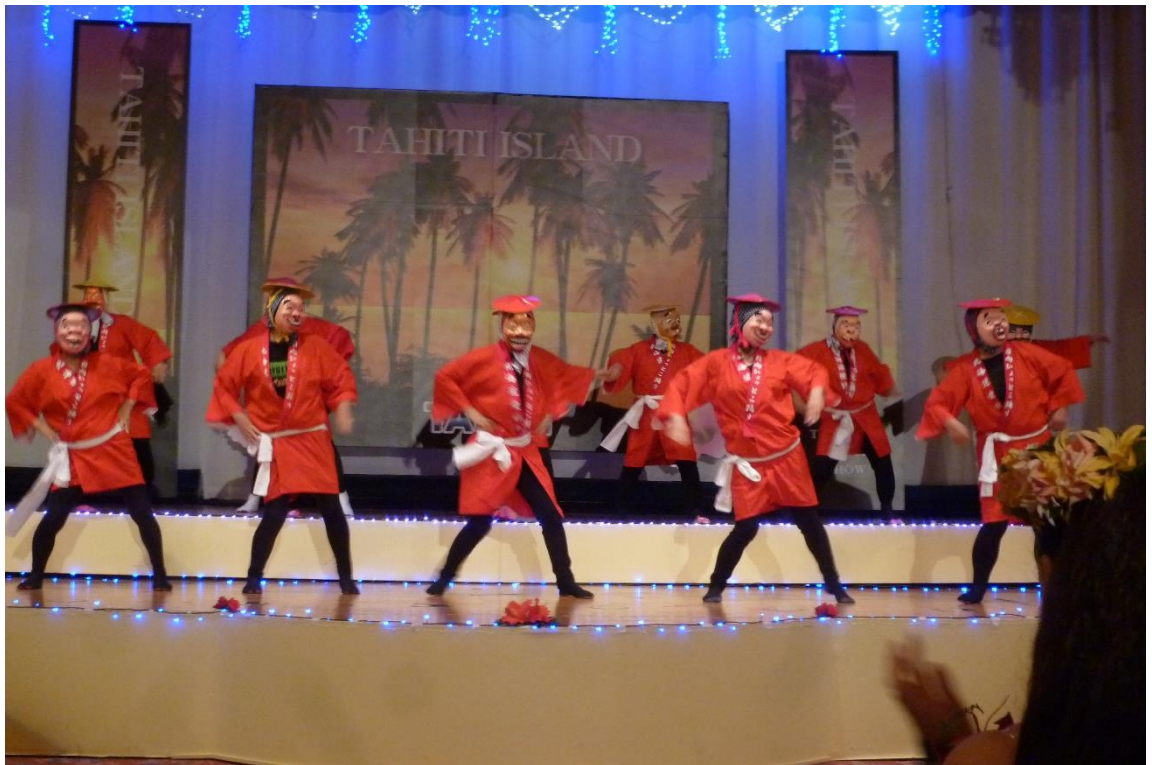
フラダンス団体発表会でのアトラクションのようす（H29年11月：苫小牧市）