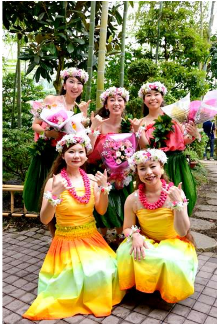
アートフェスティバルでの発表②