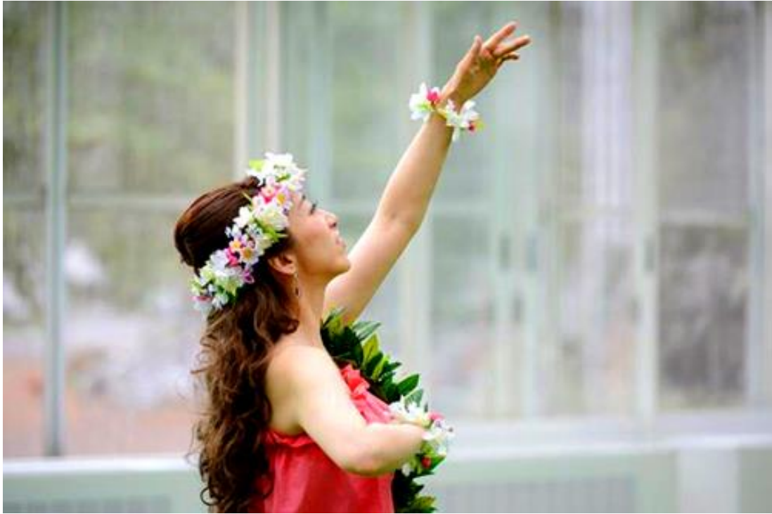
アートフェスティバルでの発表①