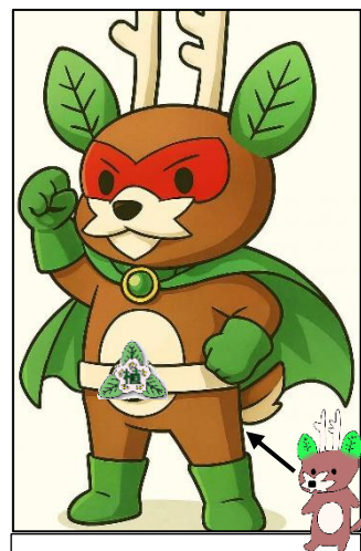
正義の味方「ウエディアー」

※「ウエディアー」は植苗小中学校開校120周年（令和5年度）の際に誕生した植苗小中学校のマスコットキャラクターです。