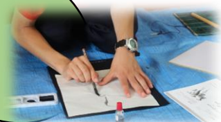
後期課程 美術「水墨画」実習