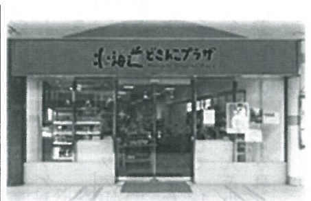
北海道どさんこプラザ有楽町店