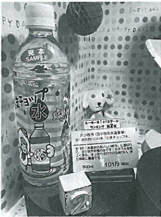
ファーストステージ売上第1位の『とまチョップ水』