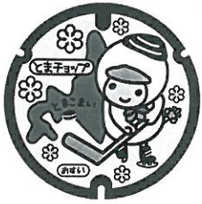
図2 「とまちヨップマンホール蓋」