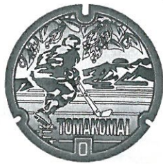
図1 「アイスホッケー蓋」

「とまちヨップ」が北海道と雪を背景に、氷都 苫小牧の代表スポーツである「アイスホッケー」を披露している、とても可愛らしいデザインとなっています。