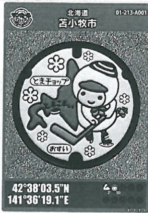
図3 マンホールカード(表)

マンホールカードとは、下水道について楽しみながら興味を持つてもらうために、下水道広報プラットフォーム(GKP)と、マンホール蓋を管理する自治体が共同で製作した世界初のマンホール蓋のコレクションカードです。平成28年4月から全国一斉に配布が開始され、平成29年8月の第5弾で222種類(191自治体)、累計発行枚数は約90万枚となり、テレビや雑誌など、様々なメディアに取り上げられ、全国的に大きな反響を呼んでいます。