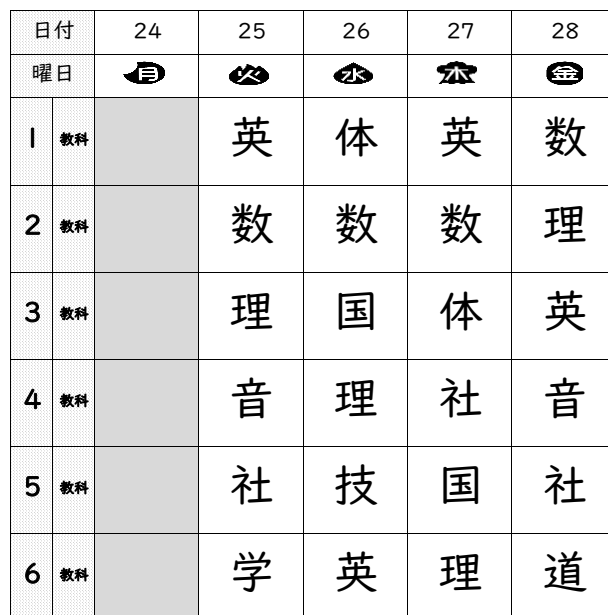
2 年 2 組 時間割