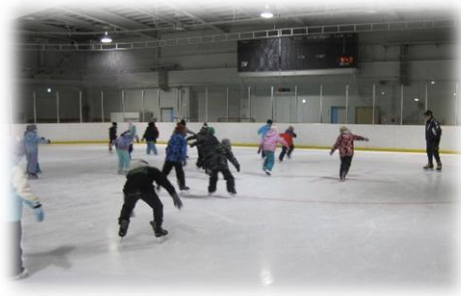
スケート学習の様子

苫小牧市の冬季を代表するスポーツであるスケートに慣れ親しむことを目的に、各学年2回のスケート学習を行いました。今年度も苫小牧体育協会に講師派遣を依頼し、指導に当たっていただきました。子どもたちは、時間いっぱい元気に滑っていました。なお、講師謝礼は PTA 予算から支出していることを申し添えいたします。