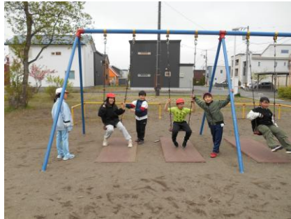
遠足(4年:清流公園・白鳥公園・拓勇公園)