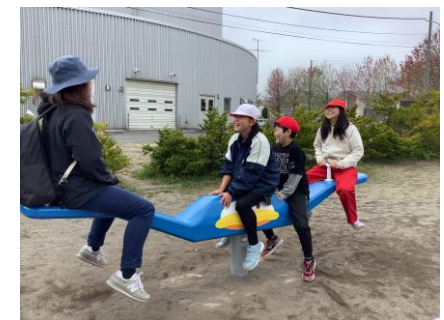
遠足(さくら:新栄公園)