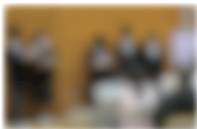
参観日(2年生)社会科