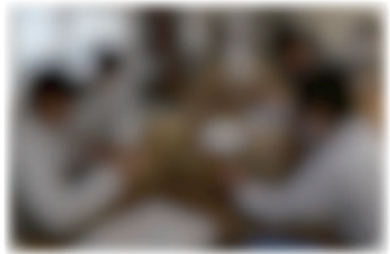
参観日(2年生)技術科