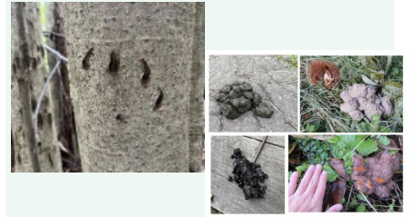
食べたもの：（上段左から）黒っぽい、クマ （下段左から）サクランボの葉、カキ 「美の国あきたネット ツキノワグマ情報」より