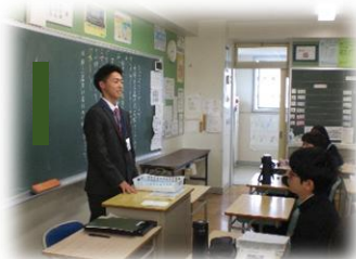
卒業生がインターンシップ