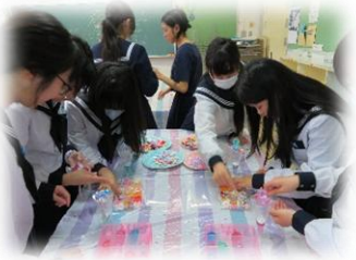
インター部・美術部 粘土細工講座受講