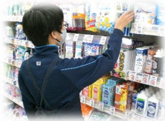
6組は3日間の現場実習実施