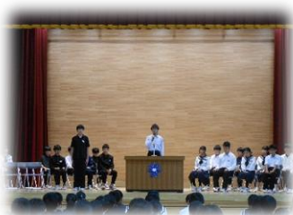
生徒会役員選挙立会演説会