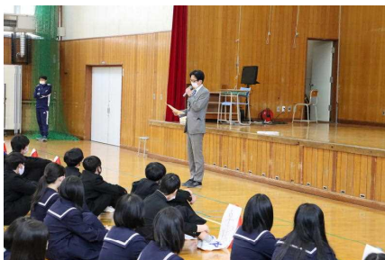
全部員が集めた部活動集会

3つ目はルールとマナーを守るということです。人として向上しなければ、技術的な向上にも、すぐに限界が訪れます。同じ目的をもった人が同じ部活に入ってきているので、チーム力を、そして個人の力を高めるためにも、部内のルールとマナーを常に忘れないで活動してほしいと思います。