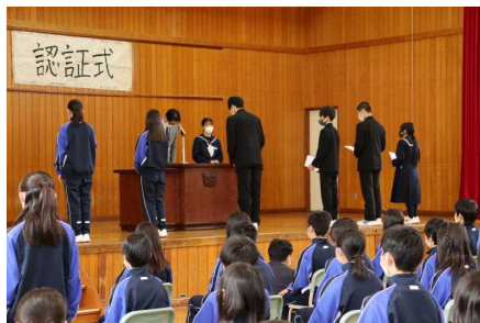
認証状を受け取る代表生徒

最後に、役員や委員に選ばれた皆さんは、「この人たちに任せて良かった!」と言ってもらえるように、悔いの残らない活動になるよう努力してください。