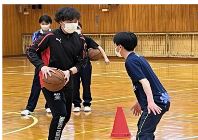
熱気あふれるバスケット部の練習