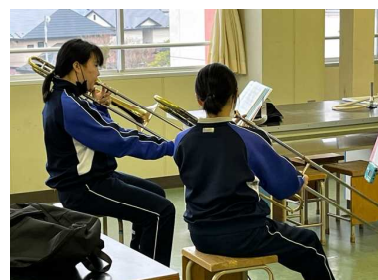
1年生が多数入部の吹奏楽部