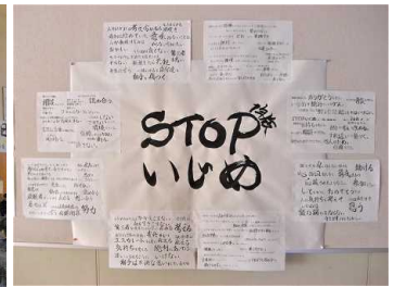
↑ 学級討議で作成された掲示物