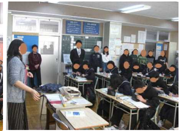
↑ 授業見学（1-3 数学）