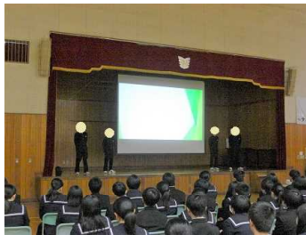
↑ 生徒会からの問題提起

1月30日（木）、生徒会主催でいじめ根絶集会が行われました。まず、生徒会から問題提起（生徒会が作成したいじめの事例を取り扱ったVTRの視聴）がされた後、学級討議を行い、考えをまとめたものを生徒玄関に掲示しました。いじめを生まない、許さない学校風土をつくりあげるため、今後もこうした取組を継続していきます。