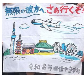
東京にも持参したスローガン

保護者の皆様、物心両面からのサポートありがとうございました。特に、出発では朝早い時間にもかかわらず、お子さんを送り出していただき感謝しています。