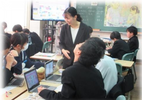
1-2（美術）学習グループで話し合い

授業改善・学力向上を目指して、11/14に校内研究会を行いました。1年生（美術）と3年生（数学 少人数指導）の授業を公開し、胆振教育局や苫小牧市教育委員会の先生方を招いて学力向上を目的に授業研究を行いました。