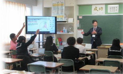
3-2（数学）少人数指導 発表の様子