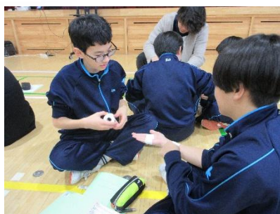
1年生職業体験講座の様子（左は保育グループ 右はスポーツグループ）