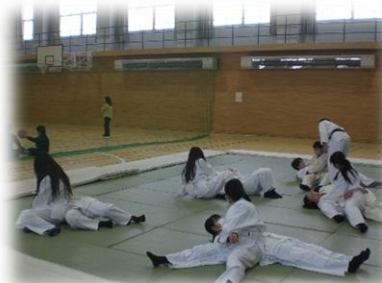
保健体育科（柔道）授業の様子（左は1年生 右は2年生）