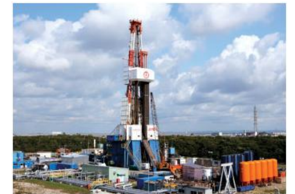
リグ（掘削機械）の完成イメージ