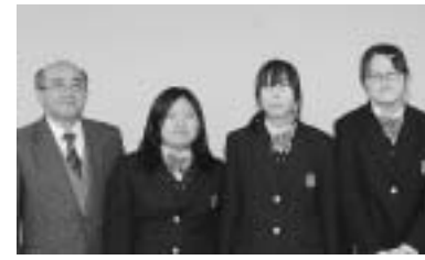
学校法人苦小牧学園 苦小牧高等商業学校 ボランティア部

昭和29年5月の部設立以来、障がい者や高齢者との交流、校外清掃など各種ボランティアを実施。半世紀以上にわたる活動を継続し、福祉のまちづくりに貢献する。