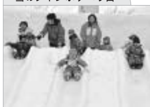
雪のジャンプすべり台

メイン会場にはさまざまなアトラクションがあります。雪の中で元気いっぱい遊びましょう！！