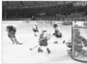
アイスホッケー大会