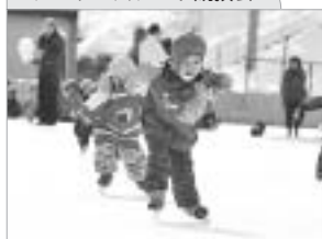
チビッコスケート競技会

市内各スケートリンクではチビッコスケート競技会やアイスホッケー大会などを開催します。また、メイン会場の特設ステージでは歌謡ショーやウルトラウインタークイズなどが行われます。スケートのまち苦小牧ならではのイベントを楽しもう！！