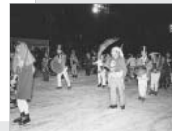
仮装パレードの様子(昭和46年)