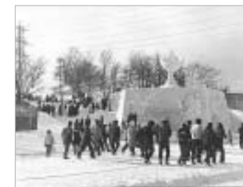
会場の様子(昭和46年)

その後、苦小牧市はスポーツを通じて健康でたくましい心と体をつくり、豊かで明るい都市を築くことを目的に、昭和41年に全国初のスポーツ都市宣言をしました。そして翌年の昭和42年に、市民の体力づくりとともに伝統のある苦小牧のスケートをさらに盛り上げようと、第1回スケートまつりが開催されました。