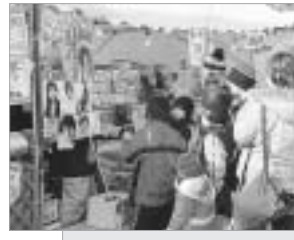
メイン会場(中央公園)の様子

スケートまつりでは食べ物やくじなどのたくさんの屋台が出店しています。冬まつりの雰囲気を楽しもう！！