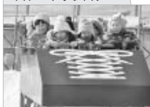
スケートボブスレー