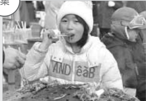
名物しばれ焼きの様子