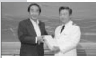
「ふじ丸」訪船式の様子

通勤定期券・通学定期券は4月1日以降も有効期限まで利用できます 現在お持ちのトマッピーカードは引き続き利用できます 小・中学生のワンコイン制度・熟年定期券は継続します ①高齢者優待乗車証(1乗車100円) ②高齢者フリーパス ③障がい者無料乗車証も引き続き利用できます 詳細 ①②介護福祉課 ☎32-6345 ③社会福祉課 ☎32-6356