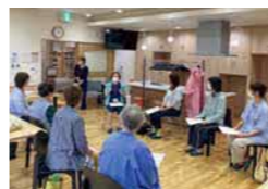
▲市内交流サロンで開催された健康講座

「人生のハンドルは自分が握っています。健康を気遣い、高齢になっても旅をしたり、シヤカシヤカ歩いたりしたいですね」と、頼もしい健康パートナーは笑顔で語ってくれました。