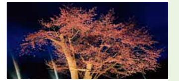
▲グラウンドにある100年桜

北には樽前山、南には太平洋が広がり、周囲は牧草地や畑、森林などに囲まれています。