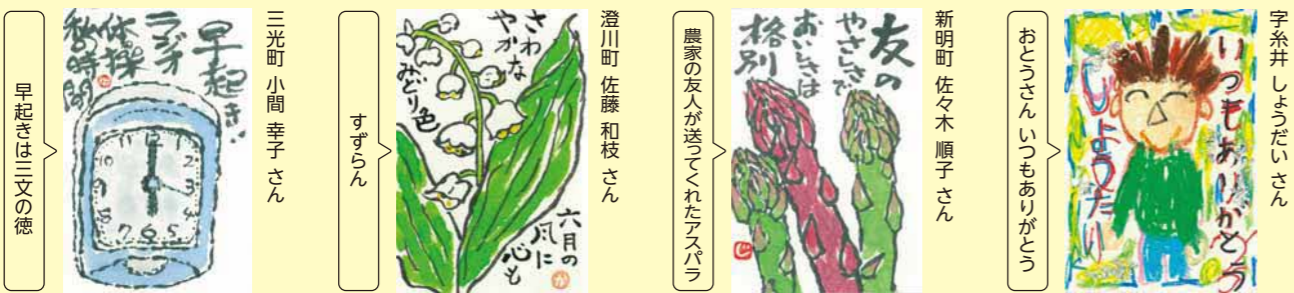
早起きは三文の徳