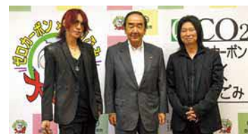
▲市役所を訪れ、脱炭素に対する活動や環境問題について、市長と対談を行ったSUGIZO氏(写真左)