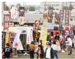
無料エリアには今年もたくさんのキッチンカーが大集合!