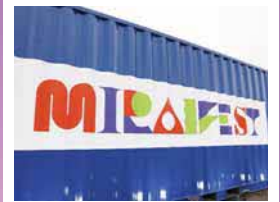
ミライフストといえば存在感抜群のコンテナ入場口!

会場まではシャトルバスを運行いたします。また会場周辺に複数の駐車場(有料/無料)を用意しています。詳細はオフィシャルサイトでご確認ください。