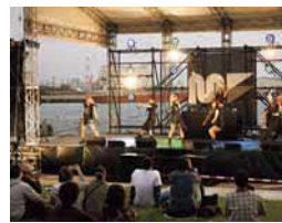
ミニステージでは、港をバックに圧巻のダンスパフォーマンスを披露します