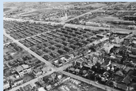
空撮写真「王子製紙中部社宅上空から南東方向を望む」 1962（昭和37）年撮影