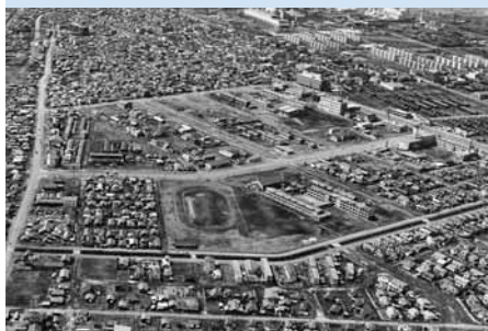
空撮写真「旭町」 1967（昭和42）年4月19日撮影

今から58年前の現在の錦町・表町・若草町・旭町を空から写した写真です。東西に横切る国道36号と2条通に挟まれるように王子製紙の東部社宅が軒を連ねています。左上には市役所の旧庁舎、現在の市総合体育館の場所には市営球場が見えます。一方、錦町と表町を分かち駅前通に面して、王子娯楽場や鶴丸デパートなど、あの時代を知る苦小牧っ子にとって懐かしい建物を見ることが出来ます。