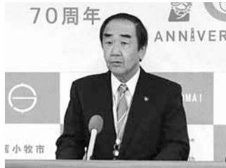
①市長就任に当たっての記者会見