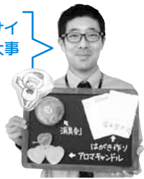
研究所のスタッフ

今年は新たな研究テーマが仲間入り。リサイクル体験を通して、資源の大切さや物を大事にする心を学びましょう！