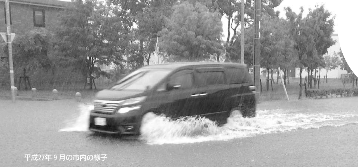
平成27年9月の市内の様子