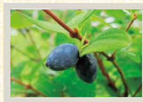
↑ 自生のハスカップの実