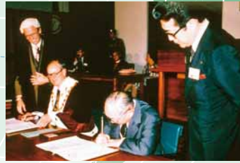
▲ 姉妹都市盟約の様子(昭和55年)