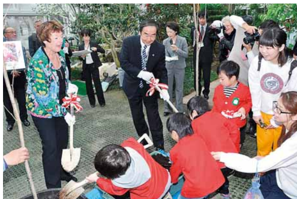
▲ ネーピア市訪問団の来訪(平成25年)

最近では、平成22年11月に苫小牧市民訪問団がネーピア市を訪問し、平成25年4月にネーピア市から訪問団の来訪がありました。