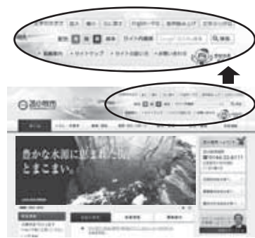
▲リニューアル後のトップページ

誰でも使いやすく、見やすく、市の情報をもっと簡単に利用できるように、2月10日から新しいホームページを公開します。今回のリニューアルでは、高齢者や障がいのある方など、誰でも利用しやすいように、文字色やサイズ変更、音声読み上げ機能などを充実