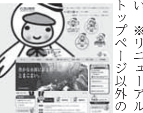
▲トップページ「とまチョップ」バージョン

しました。また、メニューの表示方法の見直しや、時代に合わせた、携帯電話・スマートフォンなどのツール対応で、知りたい情報を外出先でも探しやすい、利用できるようになりました。きせかえボタンを押すと、背景がとまチョップになる楽しい機能もありますので、ぜひ新しいホームページをご利用ください。※リニューアルに伴い、トップページ以外のアドレスは変更となり、ご注意ください。