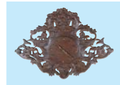
作品名 金蓮華と唐草の 掛け時計(木彫)