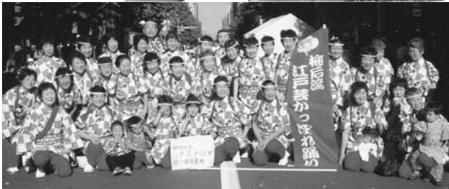
▲札幌で行われた「だい・どん・でん！2012」での一枚。踊ったあとの皆さんの笑顔が素敵です。