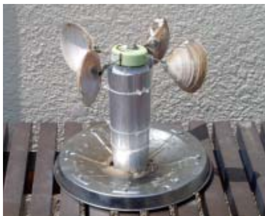
ホッキ貝の回転オブジェ