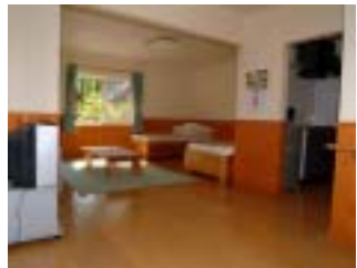
バリアフリータイプのデッキハウス外観と室内