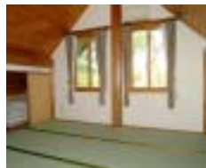
ログハウス1階居間と2階和室