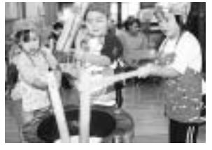
~ 保育園のもちつき ~

12月5日(水)にはまなす保育園で行われたもちつき。子どもたちは交代できねを振る、つきあがるおもちに大喜びでした。みんなでついたおもちは、あんこなどでおいしくいただきました。