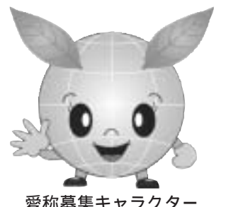
愛称募集キャラクター

このたび、19年度に実施した「053大作戦」をさらにステップアップし、資源や自然環境、温暖化対策などの地球環境問題に目を向けた「ecoライフ大作戦」を計画しています。市民の方がこの大作戦を身近に感じられるよう、イメージキャラクターを地元のデザイナーから提供を受けましたので、愛称を募集します キャラクター 左図のとおり 賞品 採用者に抽選で粗品を贈呈 応募・詳細 3月19日(木)までに、住所、氏名、年齢、性別、愛称を記入し、郵送またはファクス、Eメールで 〒053-8722 旭町4丁目5番6号 環境生活課 32)6331 FAX 32)2198 kankyo-seikaku@city.tonakomai.hokkaido.jp キャラクターのカラー画像はホームページから見るができます http://www.city.tonakomai.hokkaido.jpから環境生活課へ